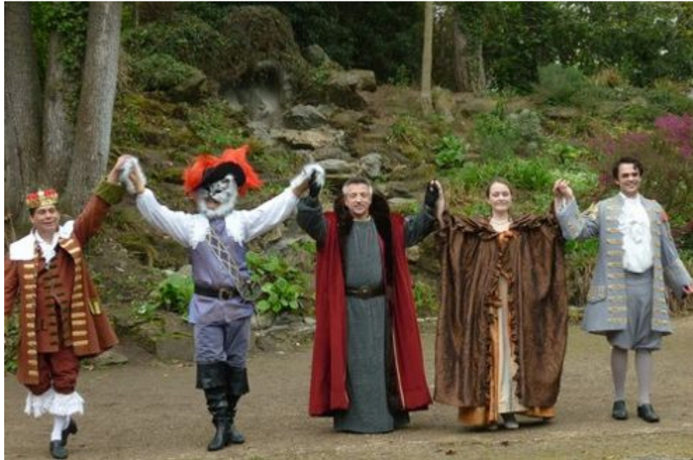
La compagnie du Vers Galant reprend les aventures de l'infatigable Chat botté.